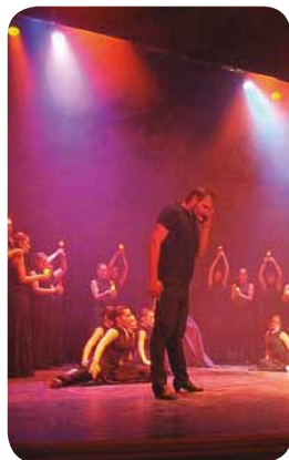
Espectáculo de danza