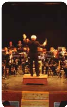
Concierto Unión Musical