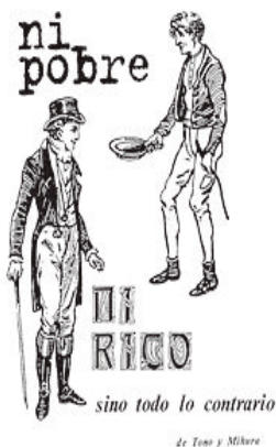
'Ni pobre ni rico sino todo...'