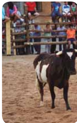
Suelta de vaquillas