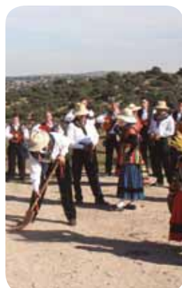
Festival Arires del Tajo