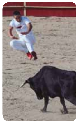
Concurso de Recortes