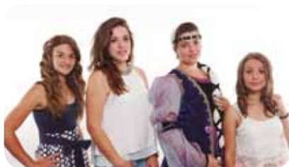
Proclamación de Reina y Damas

✓ Pregón de Fiestas a cargo de la A.C. Festival Ceslestina con motivo de la declaración del Festival Ceslestina como Fiesta de Interés Turístico Regional.