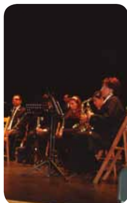
Clausura escuela de música