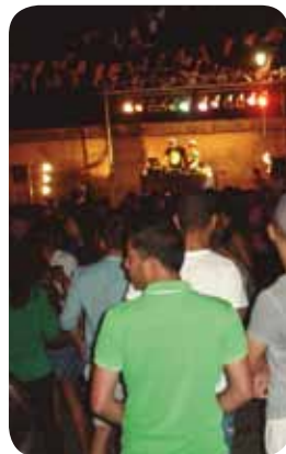
Verbena Plaza del Convento