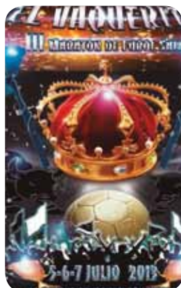
Marathon Fútbol Sala