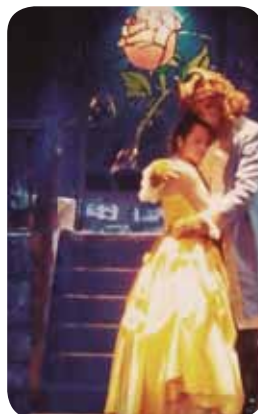
Nueva Era Teatro