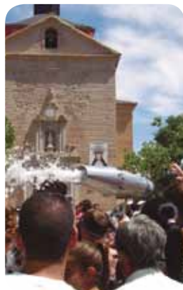
Parque Infantil acuático