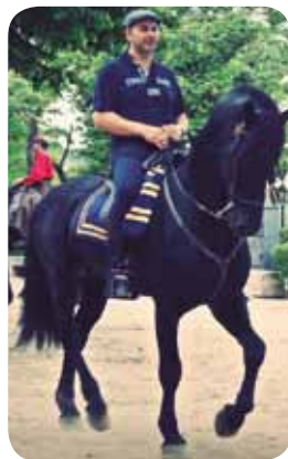
Romería a caballo