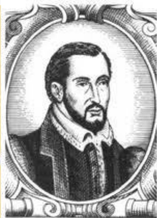
Bachiller F. de Rojas

María, en su Soledad, con constante compañía, y un Cristo que, cada día, renueva su Caridad.